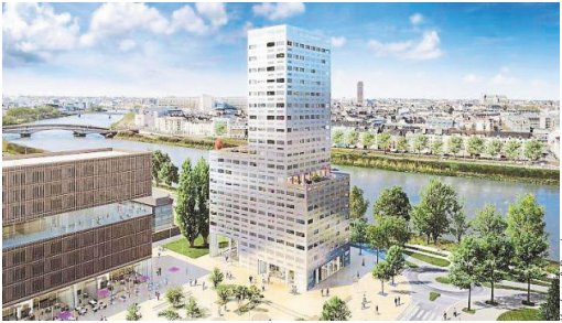
La tour 360° View s'élèvera en bord de Loire.