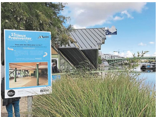
La Cocotte en verre, sur l'île Versailles, compte parmi les quinze lieux à réinventer par les Nantais.